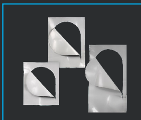
PUERTAS DE CREMALLERA