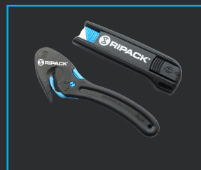
CÚTER EASY KNIFE Y SAFEKNIFE