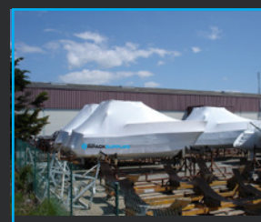
FILMS GRANDE LARGEUR