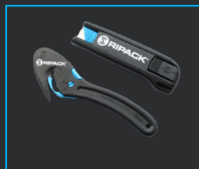
SCHNEIDEMESSER EASYKNIFE UND SAFEKNIFE